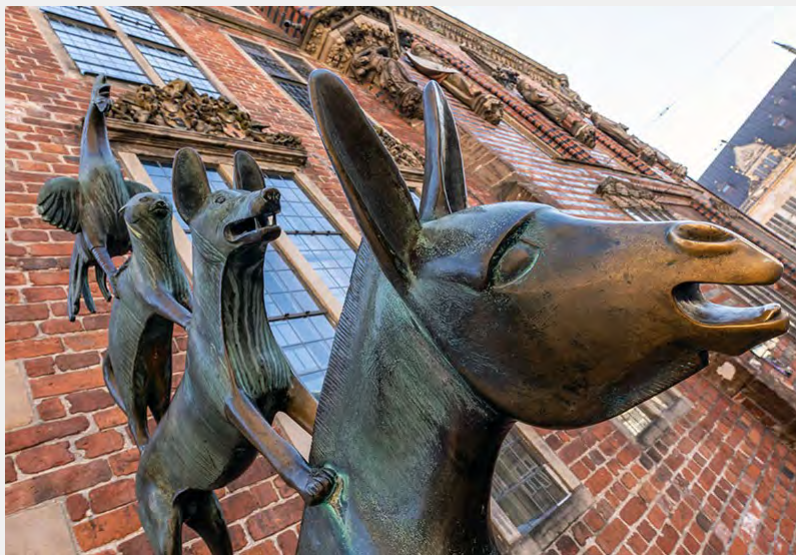
"Bremer Stadtmusikanten"