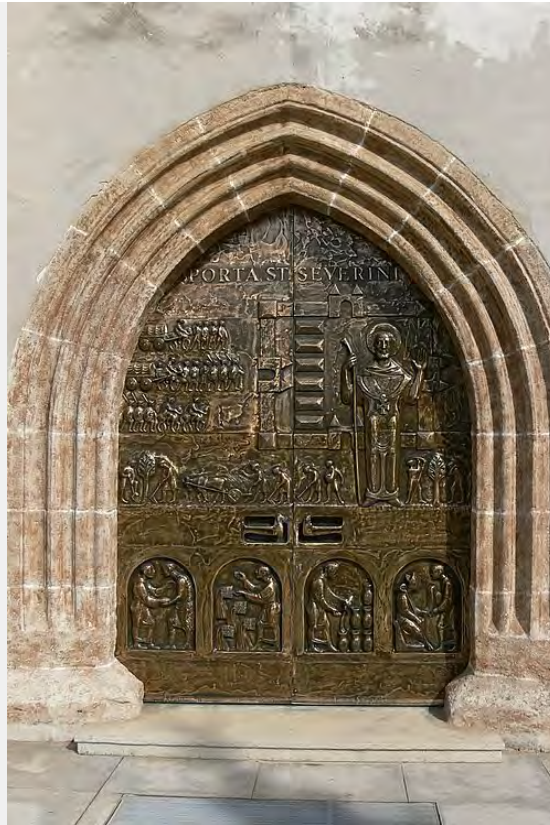
"Severinstor von Peter Dimmel (1971)"

Über viele Jahrzehnte setzte er sich mit großem Engagement für die Österreichische Gebärdensprache, für Gleichstellung und für mehr Sichtbarkeit gehörloser Menschen ein. Sein Einsatz hat die Gehörlosen-Community in Österreich nachhaltig geprägt und vielen Menschen neue Wege eröffnet.