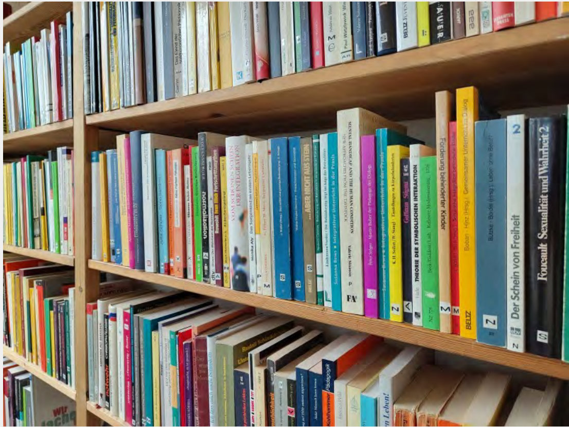
"Büchersammlung von bidok"; Bildrechte: © bidok 2026