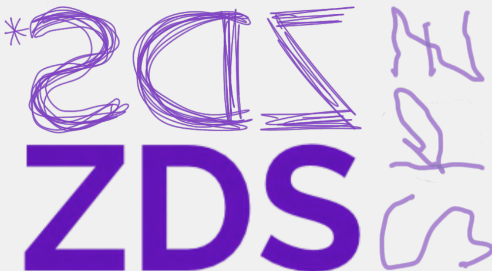
Logo der ZDS