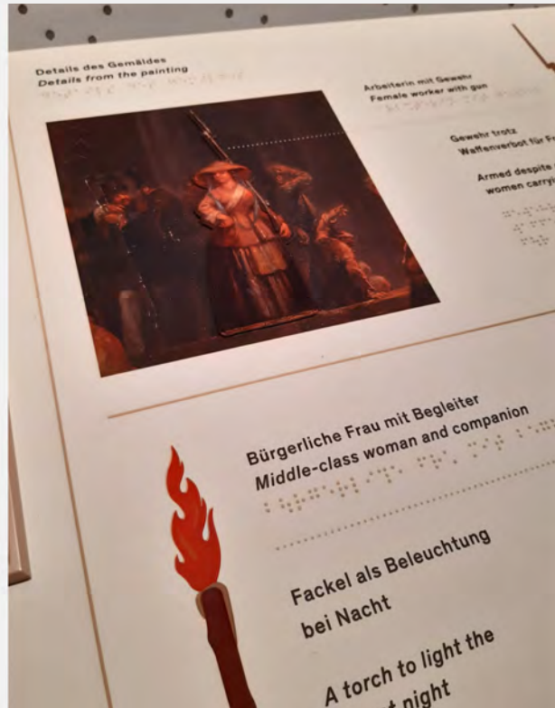
Eindrücke aus dem Wien Museum; © Volker Schönwiese

Alle Bereiche des Wien Museums am Karlsplatz sind stufenfrei oder mit Aufzug erreichbar. Zusätzlich gibt es ein Boden-Leitsystem. Das inhaltliche Museums-Konzept hat einen inklusiven Anspruch und interaktive Ausstellungs-Objekte (zum Beispiel Braille -Tafeln, tastbare Bilder, Gebärdensprach -Videos und so weiter). (Wien Museum)