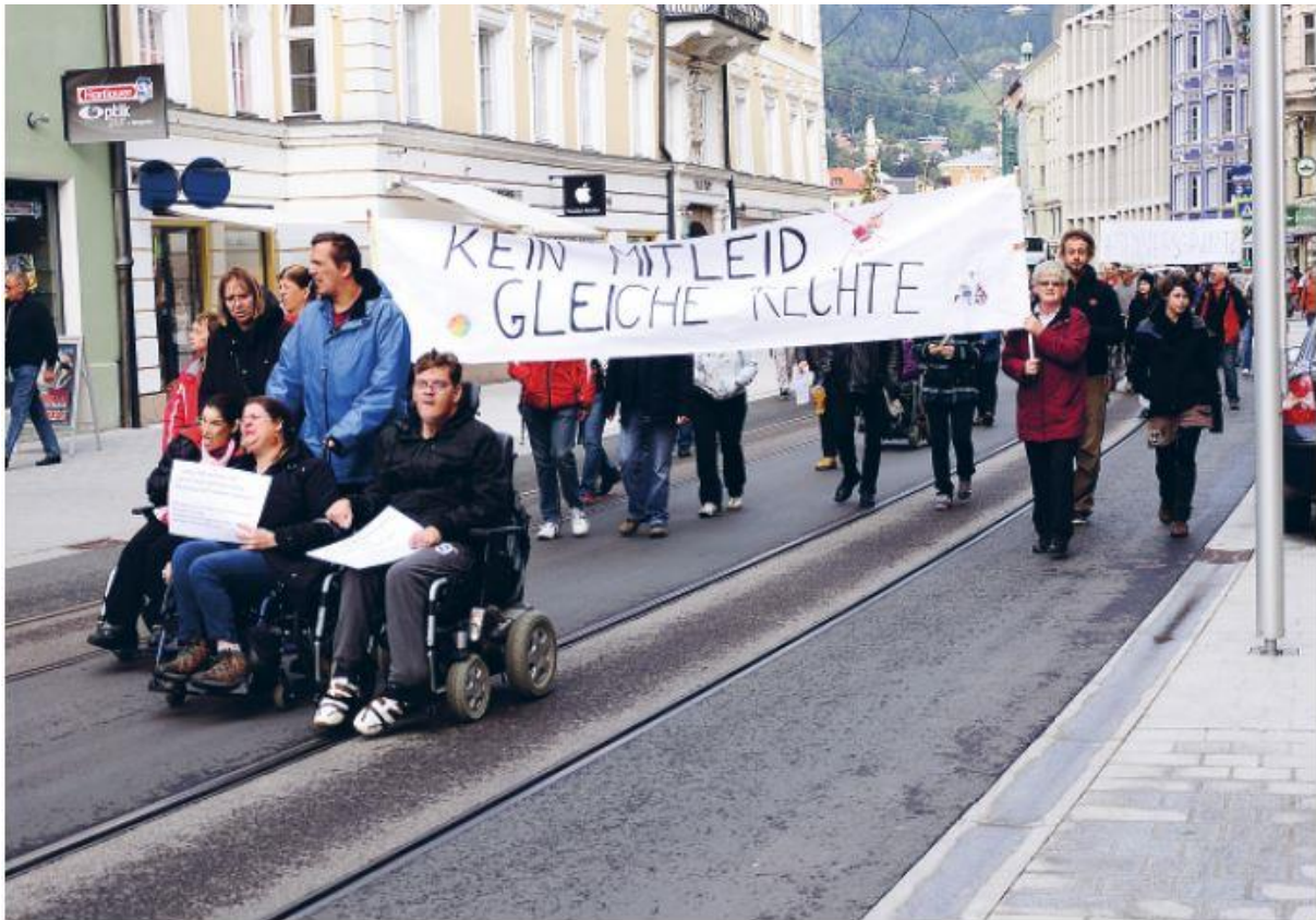
Demonstration von Aktivist:innen der Mensch Zuerst Bewegung in Innsbruck / Foto: Wibs.

Dass der Begriff Menschen mit Lernschwierigkeiten im politischen Diskurs mittlerweile durchaus verbreitet ist, sollte als politischer Erfolg der Mensch-zuerst-Bewegung verstanden werden. Dasselbe gilt für die mittlerweile gut bekannte Forderung nach Leichter Sprache: